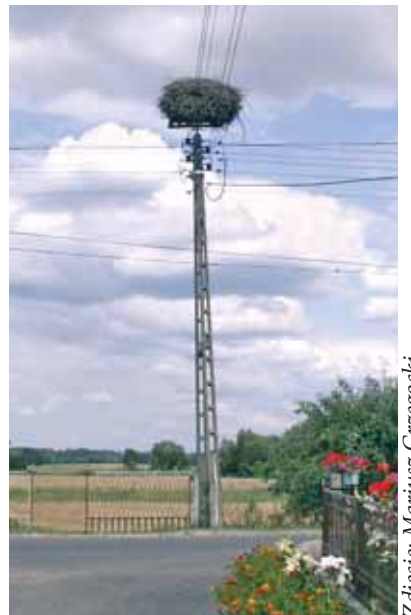
Gniazdo w Brzeźnicy.