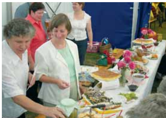
Stoły zastawione przysmakami gospodyń miejscowych i zaproszonych.