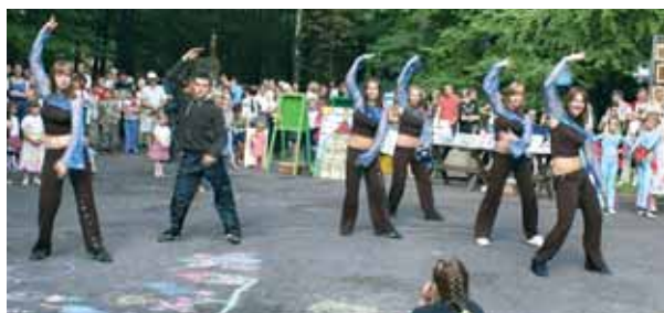
Oklaskiwany bialski zespół taneczny „PONK” z jednym tańczącym chłopcem.