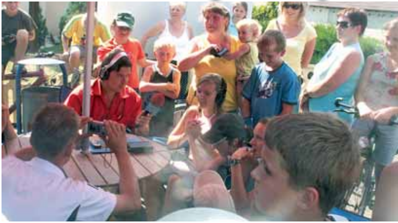
Spotkanie z ekipą Radia Opole – odpowiedzi na pytania