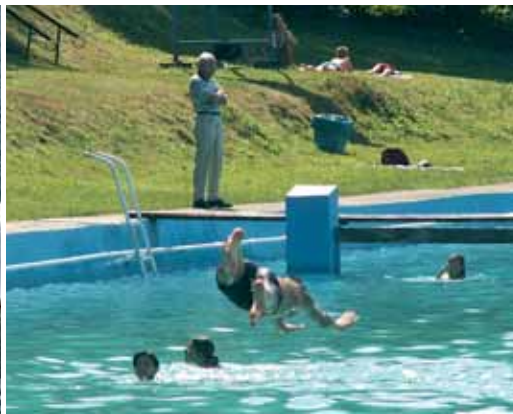
Dzieci w Białej na miejscowym basenie