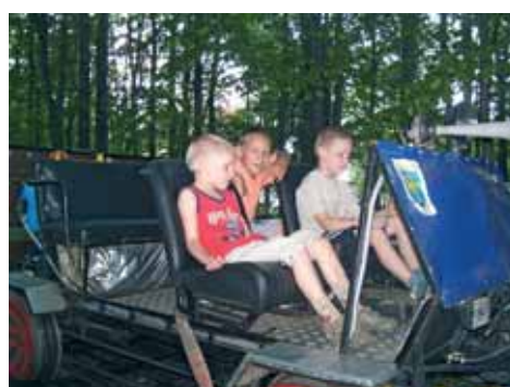
Na przywiezionej z Białej, kolejowej dreźynie.