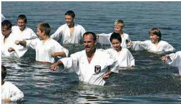
Bialscy karatecy w polskim morzu (na obozie w Sianożętach)