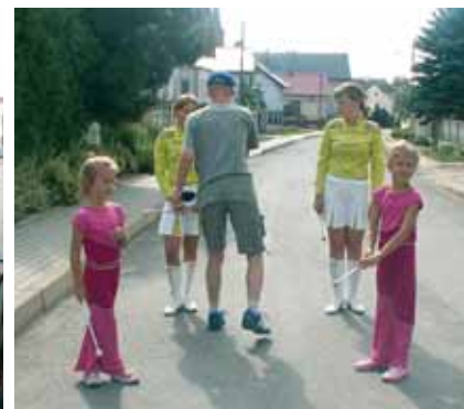
... i spotkanie z mażoretkami.