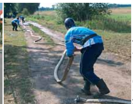
W programie popisy sławnych monocyklistów i zawody strażackie. O świętowaniu w Chrzelicach na str. 5 i 7