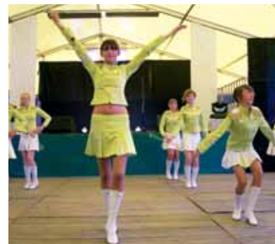
Wystąpiły bialskie mażoretki