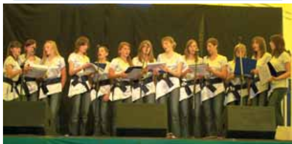
Śpiewał zespół wokalny z Chrzelic – „Gwiazdeczki”