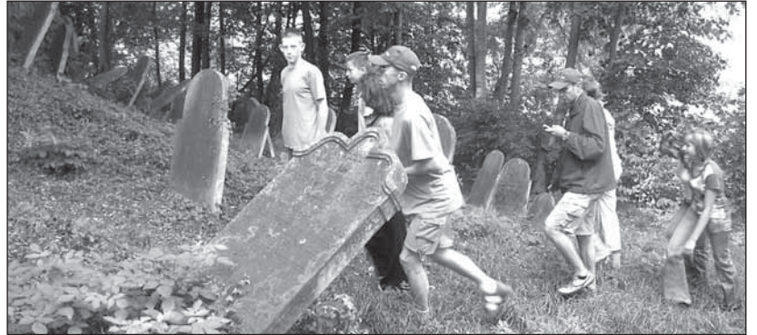
Na cmentarzu żydowskim młodzież towarzyszyła patrolowi „NTO”, który przejeżdżał przez gminę Biała.