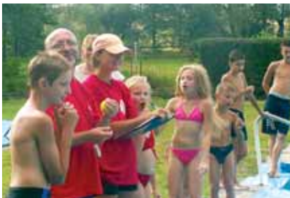
Zorganizowane zabawy i konkursy prowadził J. Kosz z ratowniczkami