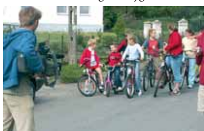
Kamerzysta TVP 3 z Opola pracował z poświęceniem, aby uzyskać efektowne ujęcia.