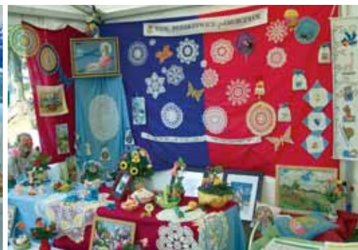
Prezentowane były nie tylko wyroby kulinarne, ale też np. koronki z KGW w Pomorzowicach.