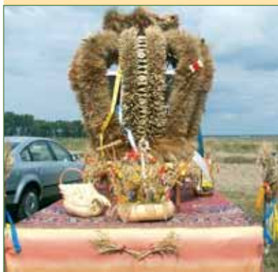
z Ligoty Bialskiej