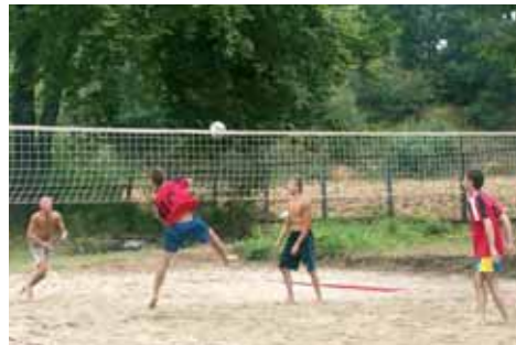
Dla dorosłych były też rozgrywki w piłce siatkowej.