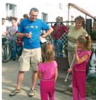
Patrol dziennikarzy „NTO” z pelotonem miejscowych rowerzystów wjechał do Prężyny, a tam spotkał się m. in. z małżonkami. O przejeździe patrolu przez gminę Biała – na str. 7