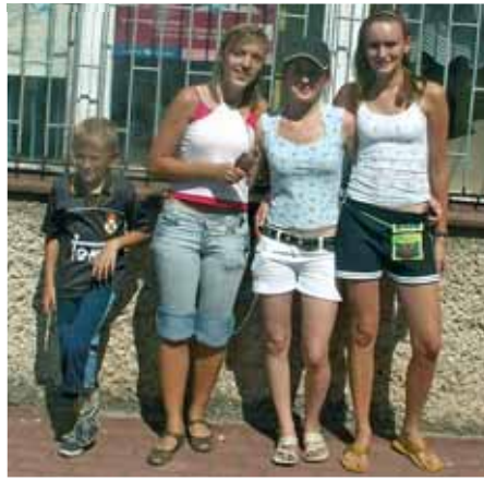
Zdobywcy głównego trofeum