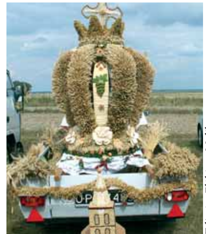
Korona ze Śmicza uznana za najpiękniejszą w gminie Biała, otrzymała też wyróżnienie na dożynkach wojewódzkich w Łosiu. O święcie płonów w Ligocie – na str. 5 i 6